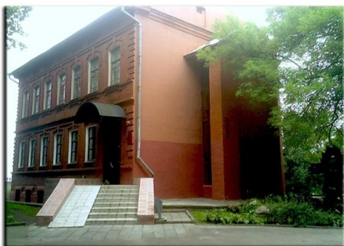
Арт-Центр М. Шагала