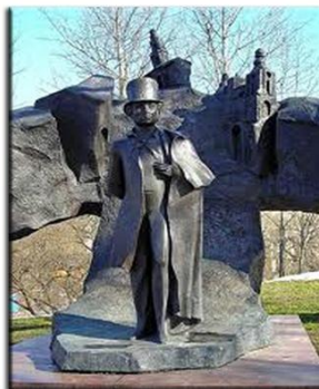
Памятник А. Пушкину