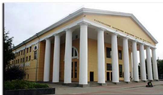
Национальный Академический Драматический Театр им. Якуба Колоса

Далеко за пределами Беларуси современный Витебск известен еще и благодаря фестивалю искусств «Славянский базар в Витебске», местом проведения которого является Летний амфитеатр.